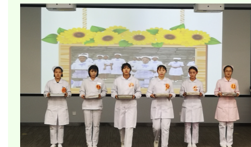
● 规培护士与实习生是医院护理的新生力量，为了让他们能够学礼守仪，中关村医院护理部在人才培养中加入礼仪学习的内容，并将学习成果进行展示。