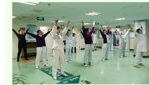
● 工会牵手科教科、健管中心在全院范围内开展“骨关节活力操 健康促进活动”。健康运动、科学运动，从现在做起，从自身做起，以更加强健的体魄投入到为患者服务中去。